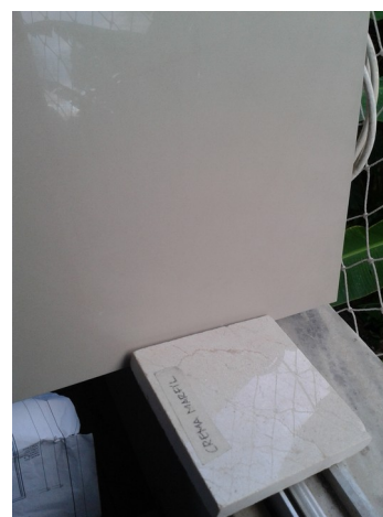
Figura 4: Porcelanato Branco 62,5x62,5cm, polido, Elizabeth e mármore Crema Marfil, polido (comparativo de acabamentos).