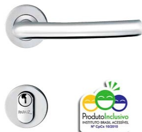
Figura 3: Fechadura MI 620 Smile, da linha Inoxvita, acabamento cromado acetinado, Papaiz.