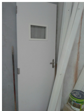
Figura 1: Porta de madeira existente, com visor de vidro, a ser aproveitada na Esterilização.