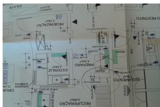
Figura 6: Indicação esquemática da mudança da localização do ar condicionado do Preparo.